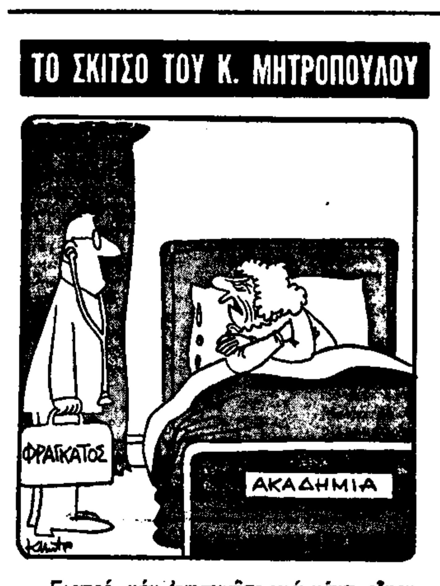
Γιατρέ, μην ανησυχείτε για μένα, είμαι αδύνατος!...