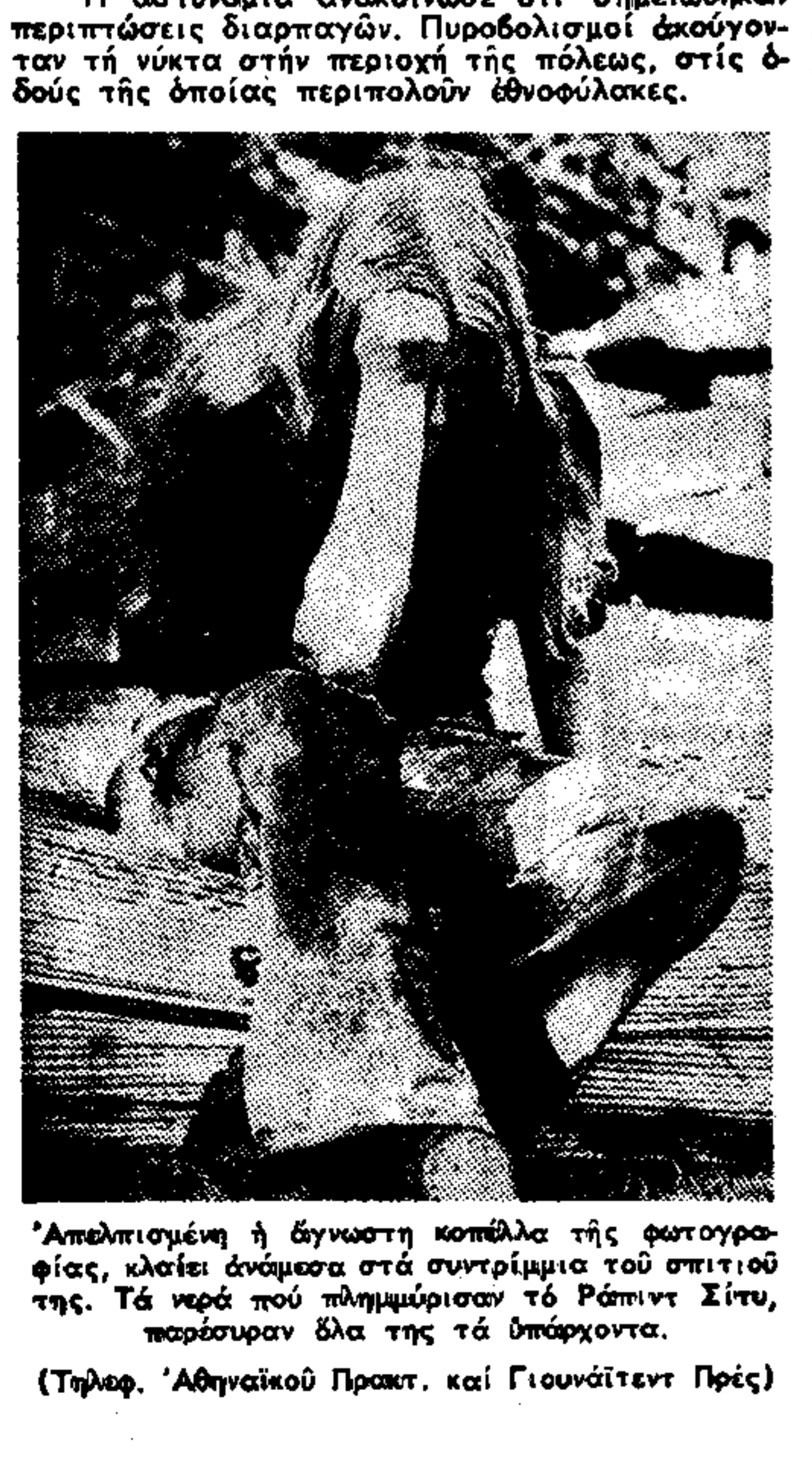
Απολιτισμένη ή άγνωστη κοπέλα της φωτογραφίας...